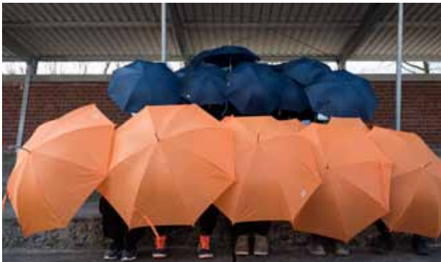
Mit einem wesentlichen Spendenanteil der Firma Holtkamp und der Volksbank Nottuln eG konnte die Tribüne gebaut werden. Schirme sind jetzt nicht mehr notwendig.

Von jedem Los, das unsere Gewinnsparer kaufen, werden 25 Cent dafür verwendet, soziale und gemeinnützige Einrichtungen zu unterstützen. Auch der Volksbank Nottuln ist es eine Herzensangelegenheit, ihrer Region Gutes zu tun. Regelmäßig erhalten wir Kärtchen mit Fotos, lieben Grüßen und einem großen Dankeschön – für uns die schönste Art zu sehen, dass unser Engagement genau an der richtigen Stelle ankommt.