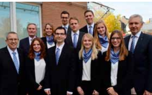
Unsere aktuellen Azubis mit den Vorständen

VB-TEAM Junge Menschen auszubilden hat für die Volksbank Nottuln schon lange eine hohe Priorität.