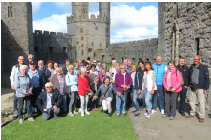
Teilnehmer der Bankreise Mittelengland