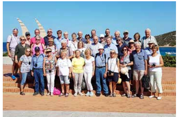
Teilnehmer der Bankreise Sardinien