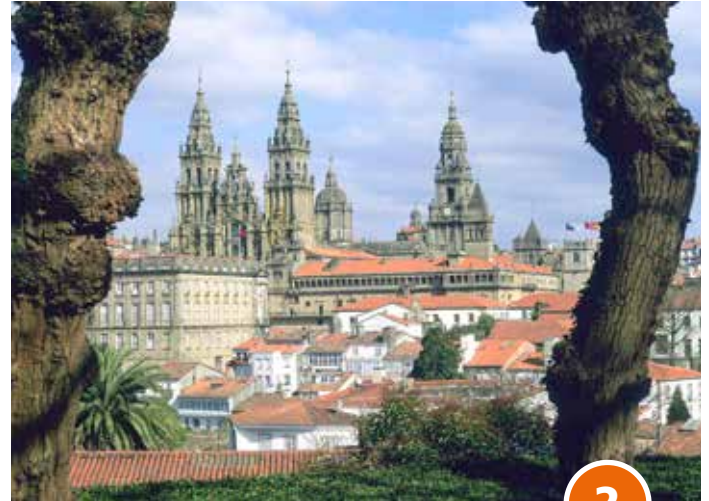
Santiago de Compostela in Nordspanien