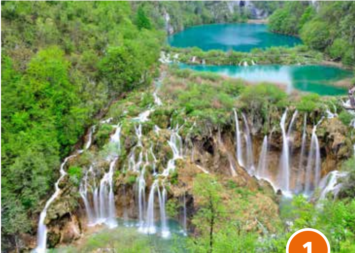
Plitvicer Seen in Kroatien

Reisen mit der Volksbank sind für viele Kunden bereits zu einer festen Institution im Jahreskalender geworden. In diesem Jahr standen mit Mittelengland und Sardinien zwei tolle Reisen zur Auswahl, die bei den Teilnehmern wieder für viele unvergessliche Momente gesorgt haben. Auch für das Jahr 2020 stehen die Bankreisen schon fest.